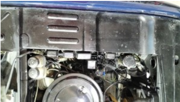
1/2 bloc avant gauche.

La carrosserie du véhicule a été repeinte par l'un des anciens propriétaires ( pas de facture ). Etat de la peinture moyen.