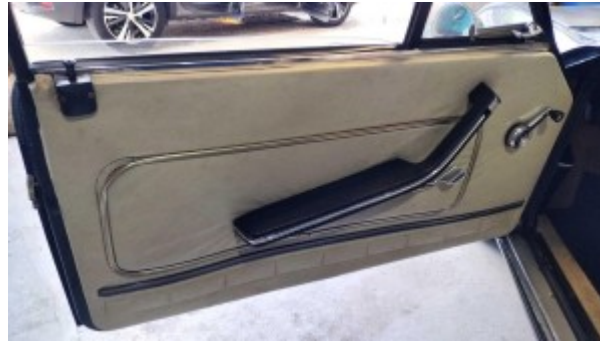
Panneau de porte conducteur