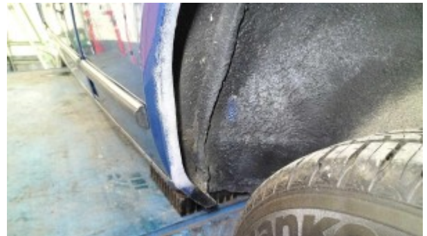
Passage de roue arrière gauche