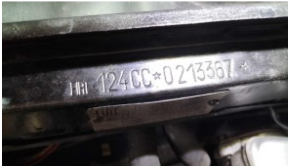
Frappe à Froid du numéro de chassis.