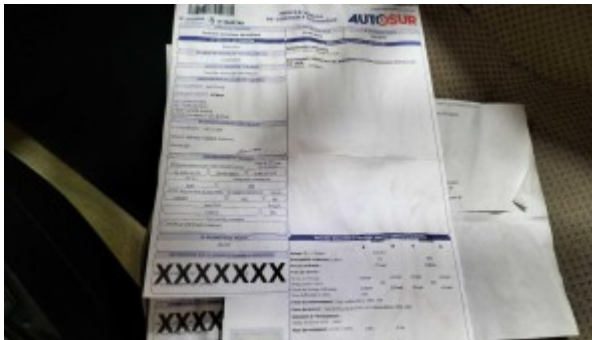
Dernier contrôle technique

Observations : Contrôle technique daté du 02 Mars 2023