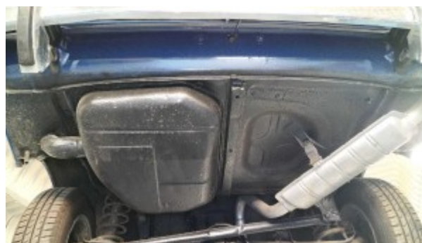
Soubassement vue inférieure