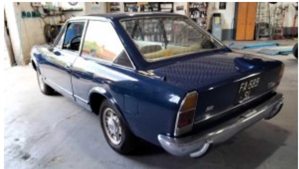
¾ Arrière gauche