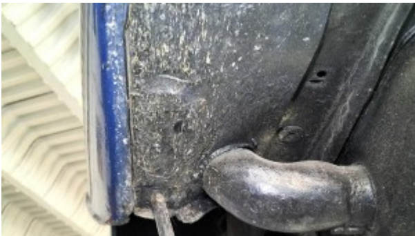
traces de réparation passage de roue arrière gauche.