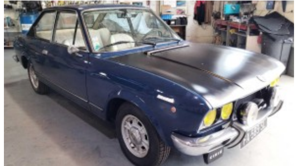
¾ Avant droit