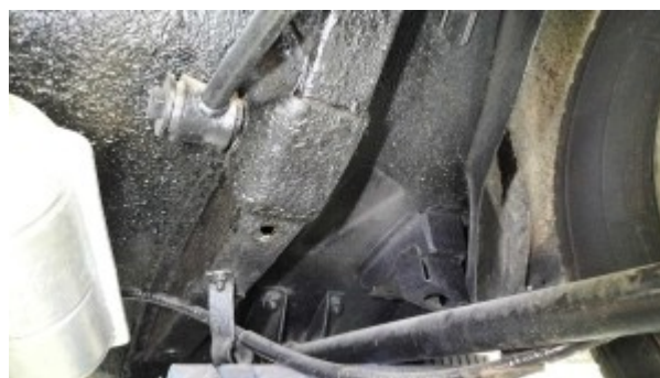
Longeron arrière droit