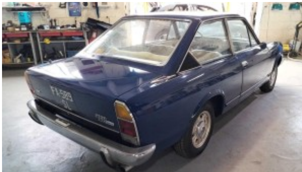
¾ Arrière droit