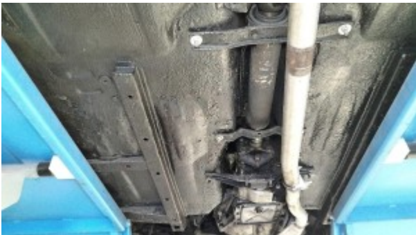
Vue inférieure soubassement arrière.