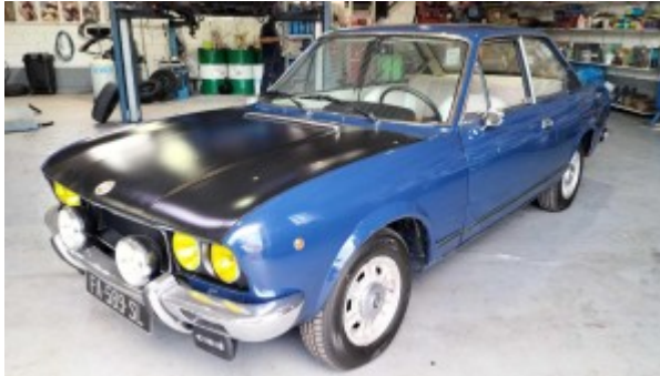
¾ Avant gauche