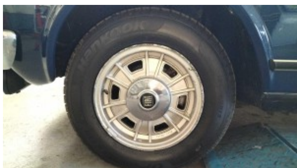
Roue avant gauche

Les 4 jantes sont dans un état moyen avec défauts d'aspect esthétique. Les pneumatiques sont datés de l'année 2018.