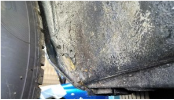
Traces de réparations passage de roue avant droit