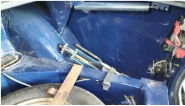
Longeron arrière droit