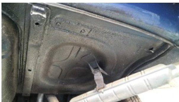
Plancher arrière vue sous caisse.