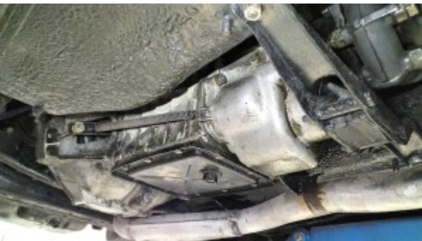
Fuite d'huile boite de vitesses