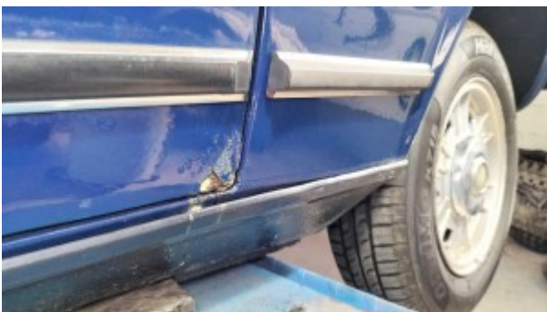
Corrosion bas de porte passager