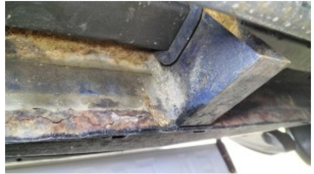
Corrosion face avant