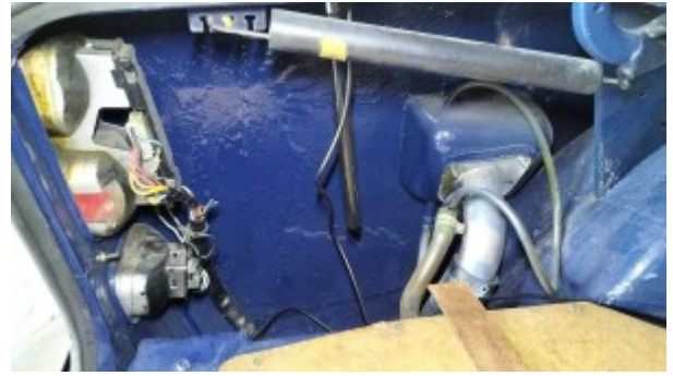
Passage de roue arrière gauche