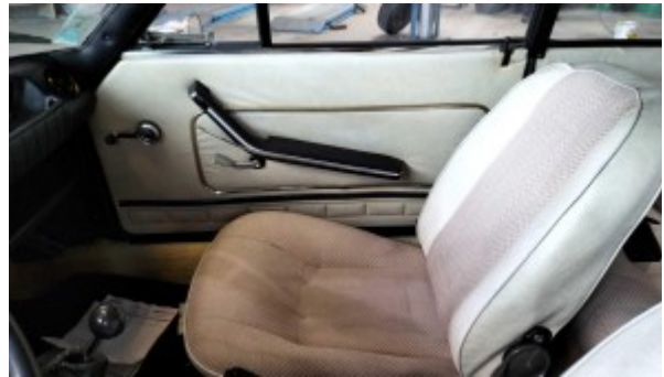
Siège passager avec panneau de porte passager