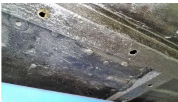
Réparations plancher sous caisse.