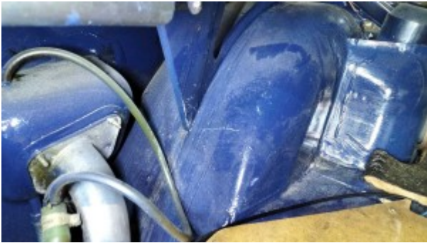
Passage de roue arrière gauche.