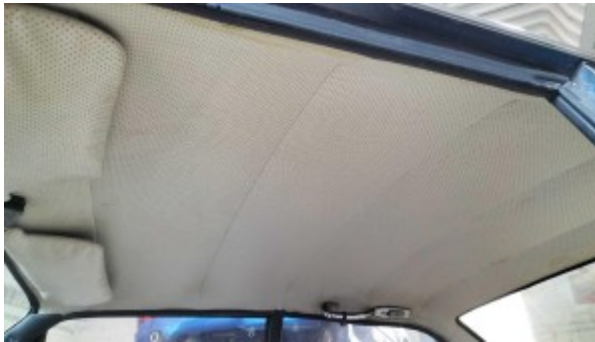
Ciel de toit