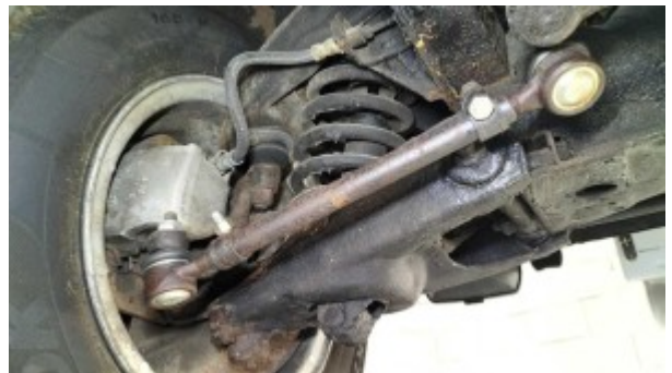
1/2 train avant gauche