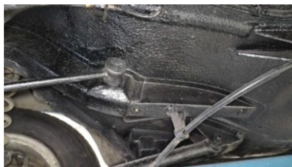
longeron arrière gauche vue sous caisse.