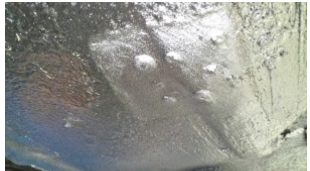
Traces de reparations au niveau du plancher