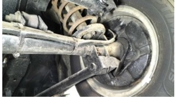
pont arrière coté droit.