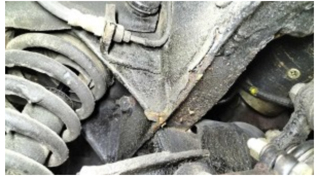
Traces de corrosion feuillures brancard avant gauche