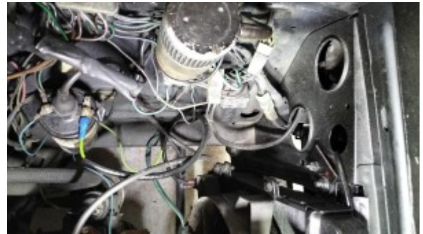
Longeron avant gauche vue supérieure.