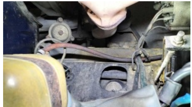
Longeron avant droit